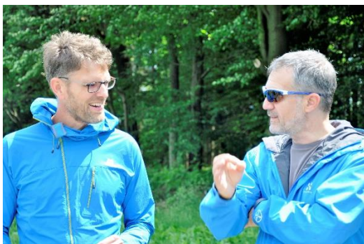
Einflussfaktoren erkennen - empathisches zuhören

Dabei ist es wesentlich, die Einflussfaktoren zu kennen, welche auf den Prozess wirken. Das gilt im Projektmanagement mit Six Sigma genauso, wie in der systemischen Beratung.