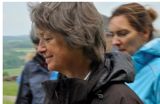
Verkörperte Kognition als systemisches Werkzeug

Bei der systemischen Beratung werden alte Denkmuster überwunden.